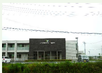
ふたば医療センター附属病院